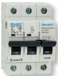
Poder corte 10KA formador por: RV30HC2...+RV30ACCO31N