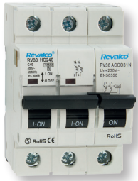
Poder corte 6KA formador por: RV30BC2...+RV30ACCO21N